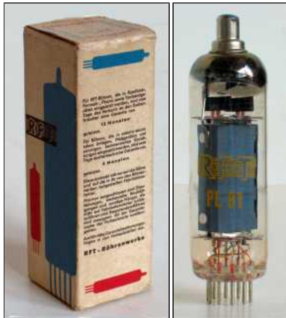
RFT PL81 doosje