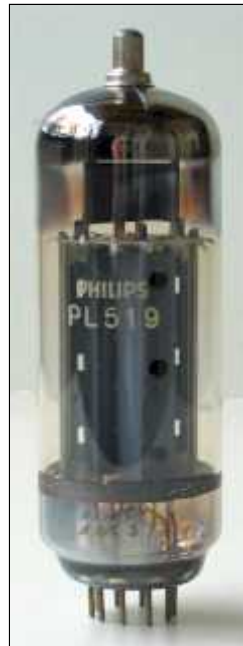
Philips PL519 Code AF, rev A, Heerlen, nov 1973