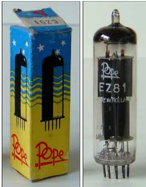
Doosje Pope EZ81