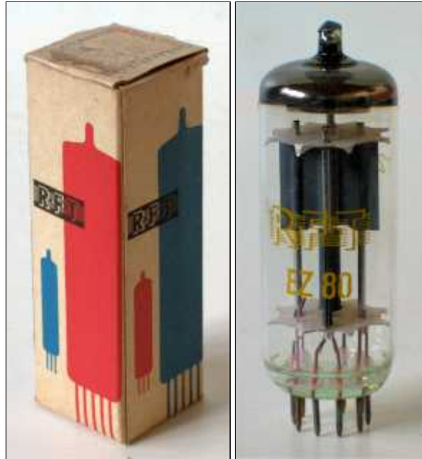
Doosje RFT EZ80