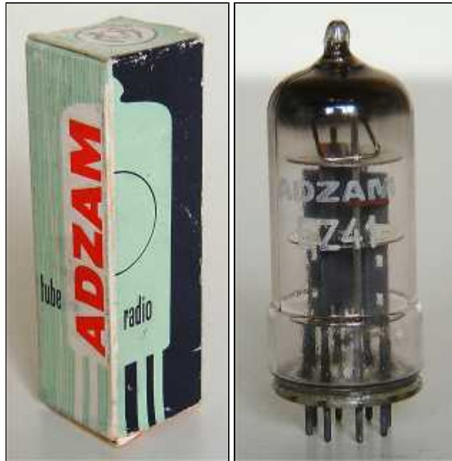
Doosje Adzam EZ41