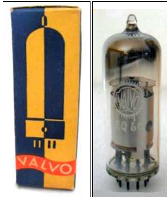
Doosje Valvo EQ80