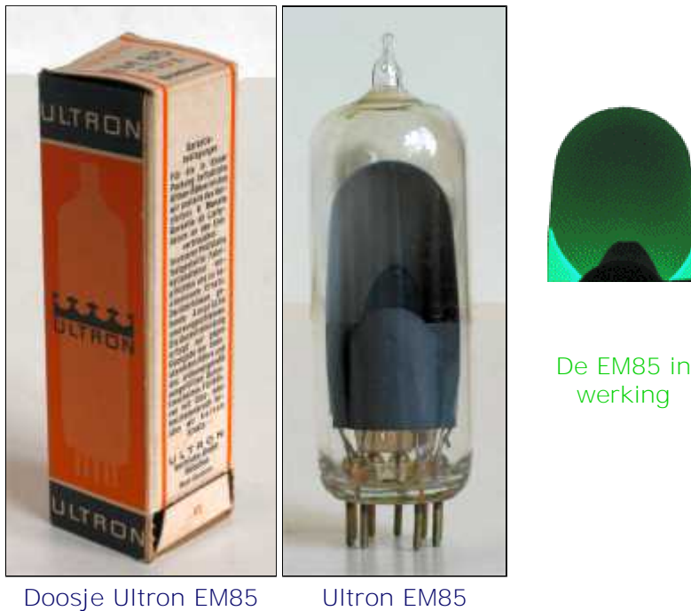
Doosje Ultron EM85