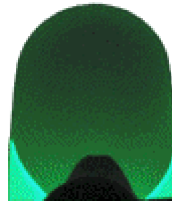
De EM81 in werking

Philips EM81 Code GM, rev 3, MBLB Brussel, jan 1951, week 1