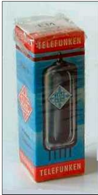
Doosje Telefunken EM80