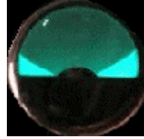
Lichtbeeld van de EM71