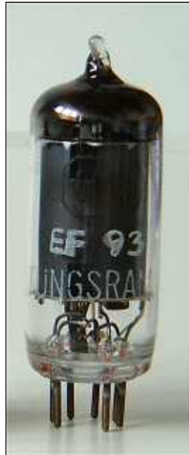
Tungram EF93 6BA6