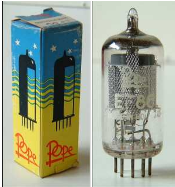
Doosje Pope EF86