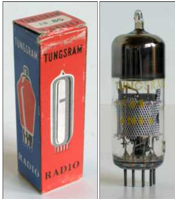
Doosje Tunggram EF85