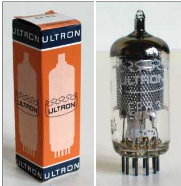
Doosje Ultron EF83