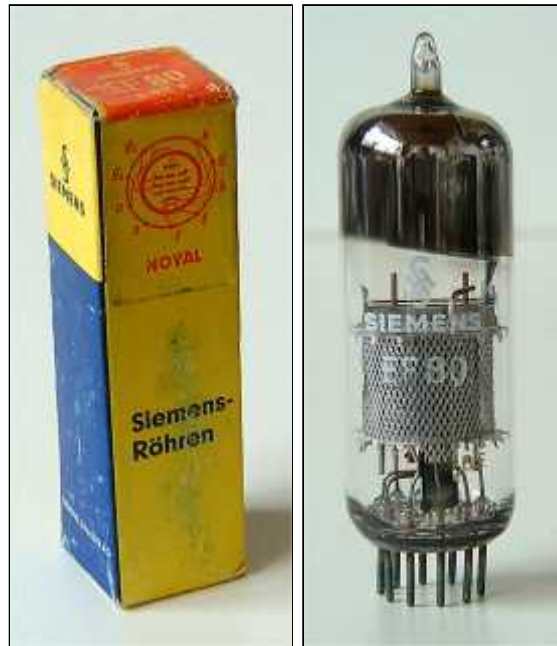
Doosje Siemens EF80 Siemens EF80