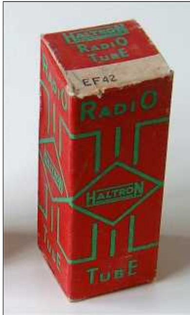
Doosje Haltron EF42