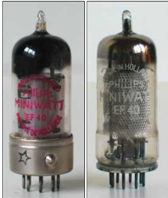
Philips EF40 Code L9, ver 1, okt 1955