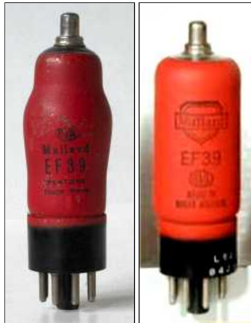
Mullard EF39 "Pentone" Trade Mark