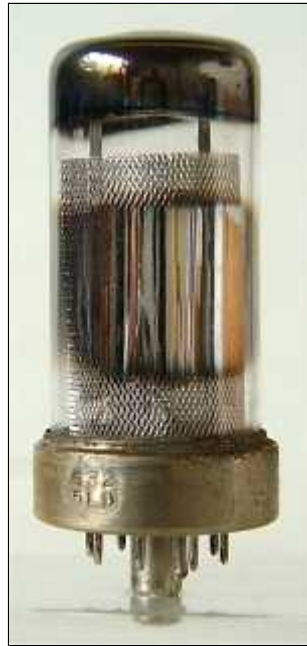
Philips EF22 Code 63, rev 2, dec 1945, wk 4