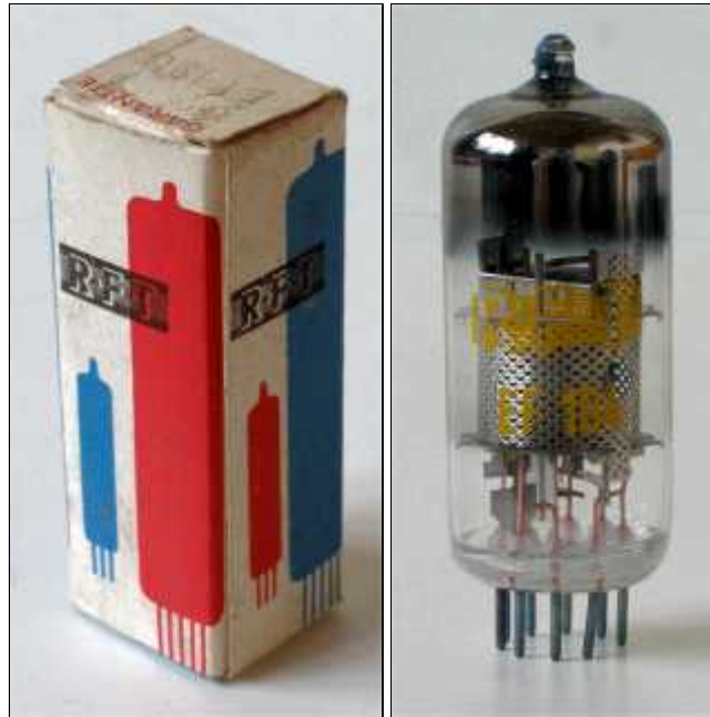
Doosje RFT EF184