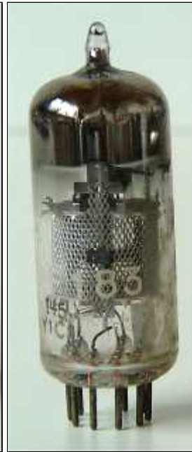
Pope EF183 Code I4, rev 5, Sittard, mrt 1961, week 1