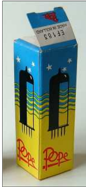
Doosje Pope EF183