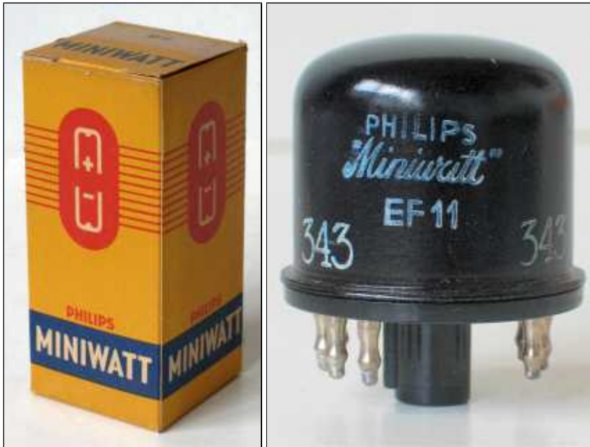
Doosje Philips EF11