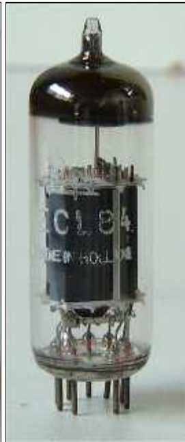
Pope ECL84 Code f4, rev 2, Heerlen, mei 1961, week 5