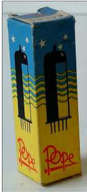
Doosje Pope ECL84