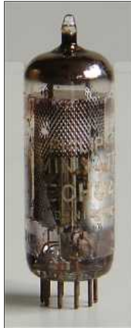
Philips ECH84 Heerlen, aug 1963, wk 1