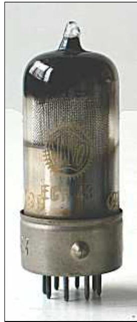
Valvo ECH43 Code PC, rev 1, 1947, Hamburg