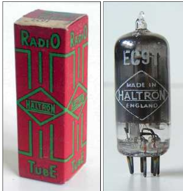
Doosje Haltron EC91