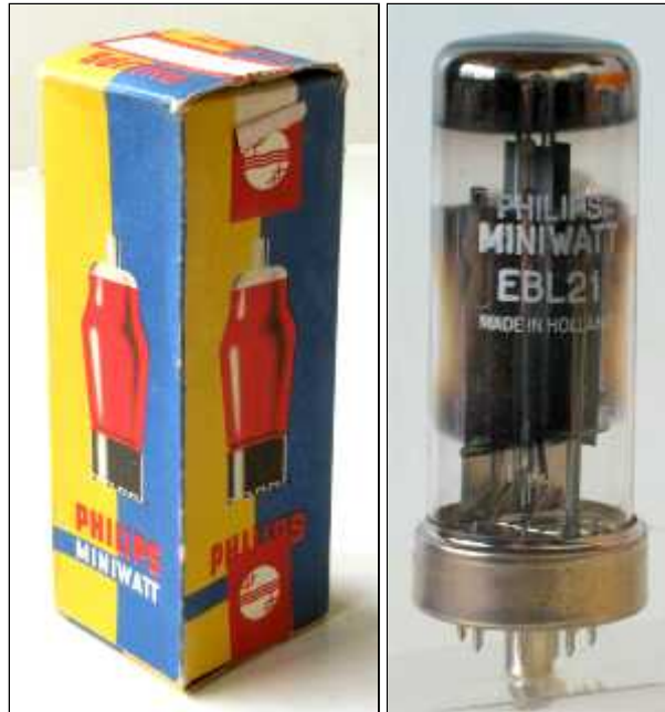
Doosje Philips EBL21