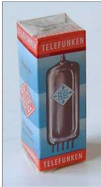
Doosje Telefunken EAF801