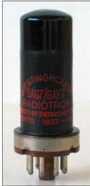
Westinghouse 6AG7 Radiotron