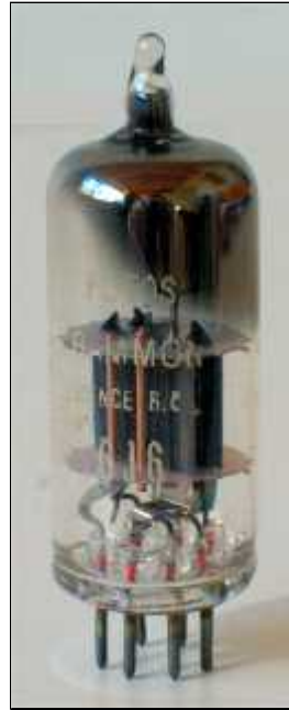
6J6