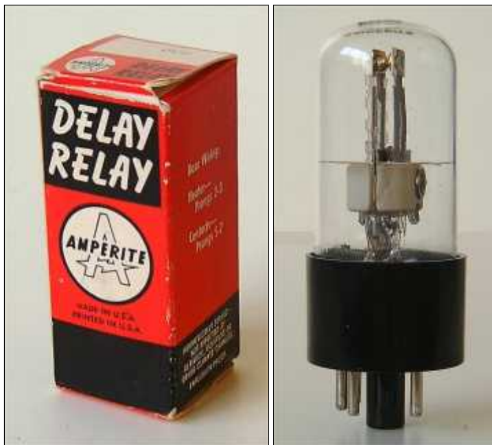
Doosje Amperite 6C2