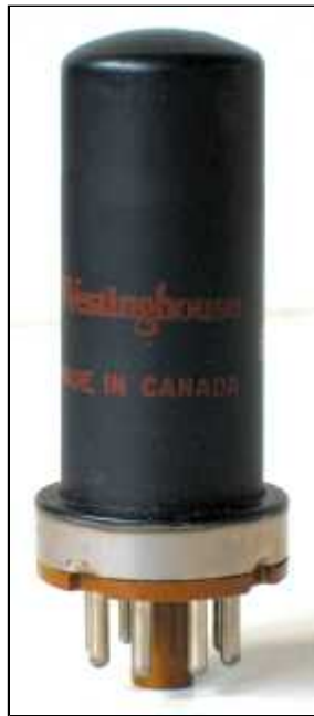
Westinghouse JAN 6AK7/6AG7