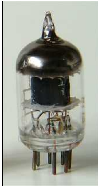
Mullard 6AK5W/CV850 Code 59, Mullard Whyteleafe, feb 1956