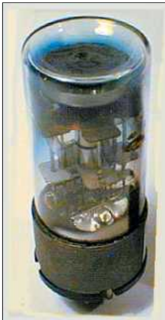
Mazda 6AF7G metal