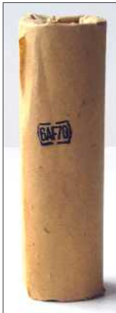
Wikkel Mazda 6AF7G